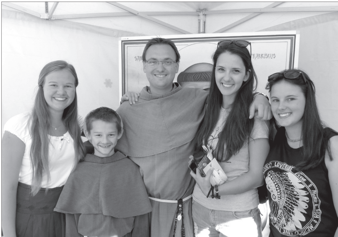
Stretnutie mládeže P15 – predstavenie rehoľných spoločností

Sv. František je v Cirkvi uctievaný ako zakladateľ troch rádov. Prvý rád je mužskou reholou, druhý rád sú mníšky – klarisky, tretí rád tvoria tí, ktorí prijímajú Františkovu spiritualitu za svoju vlastnú cestu, nevstupujú však do kláštorov. Prvý rád združuje dnes okolo 30 000 mužov v troch reholiach (františkáni, minoriti, kapucíni). Prečo ale nie je jednotný? Ktorá rehoľa je pôvodnou reholou založenou sv. Františkom? Tieto otázky zaznievajú pomerne často.