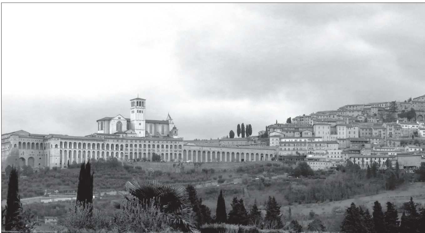
Fotografia mesta Assisi

Na začiatku 15. storočia vzniklo vo vnútri rehole hnutie hlásajúce obnovu pôvodnej chudoby a jednoduchosti ako aj zrieknutie sa privilégií, ktoré rehoľa v priebehu vekov dostala. Reformu presadzovali dôležité osobnosti ako napr. sv. Ján Kapistránsky. Bratia, ktorí ju prijímali, sa zaväzovali k úzkostlivému zachovávaní predpisov reguly, preto sa začali označovať ako observanti . Keď hnutie zosilnelo a získalo podporu cirkevnej i svetskej vrchnosti, dosiahli observanti veľkú nezávislosť. Stali sa vikariátom, ktorý mal vlastné pravidlá a vlastného predstaveného. Časom získali prevahu, takže konventuáli sa stali menšinou, ktorá sa svojho spôsobu života nechcela vzdať. Dochádzalo aj ku konfliktom, ktoré poškodzovali dobré meno rádu. Problém sa pokúsil vyriešiť pápež Lev X. V roku 1517 vydal bulu, ktorou františkánsky rád rozdelil na dve nezávislé rehole: Menších bratov observantov a Menších bratov konventuálov (minoritov). Oba rády si zachovali spoločnú Regulu sv. Františka, vypracovali však rozdielne konštitúcie.