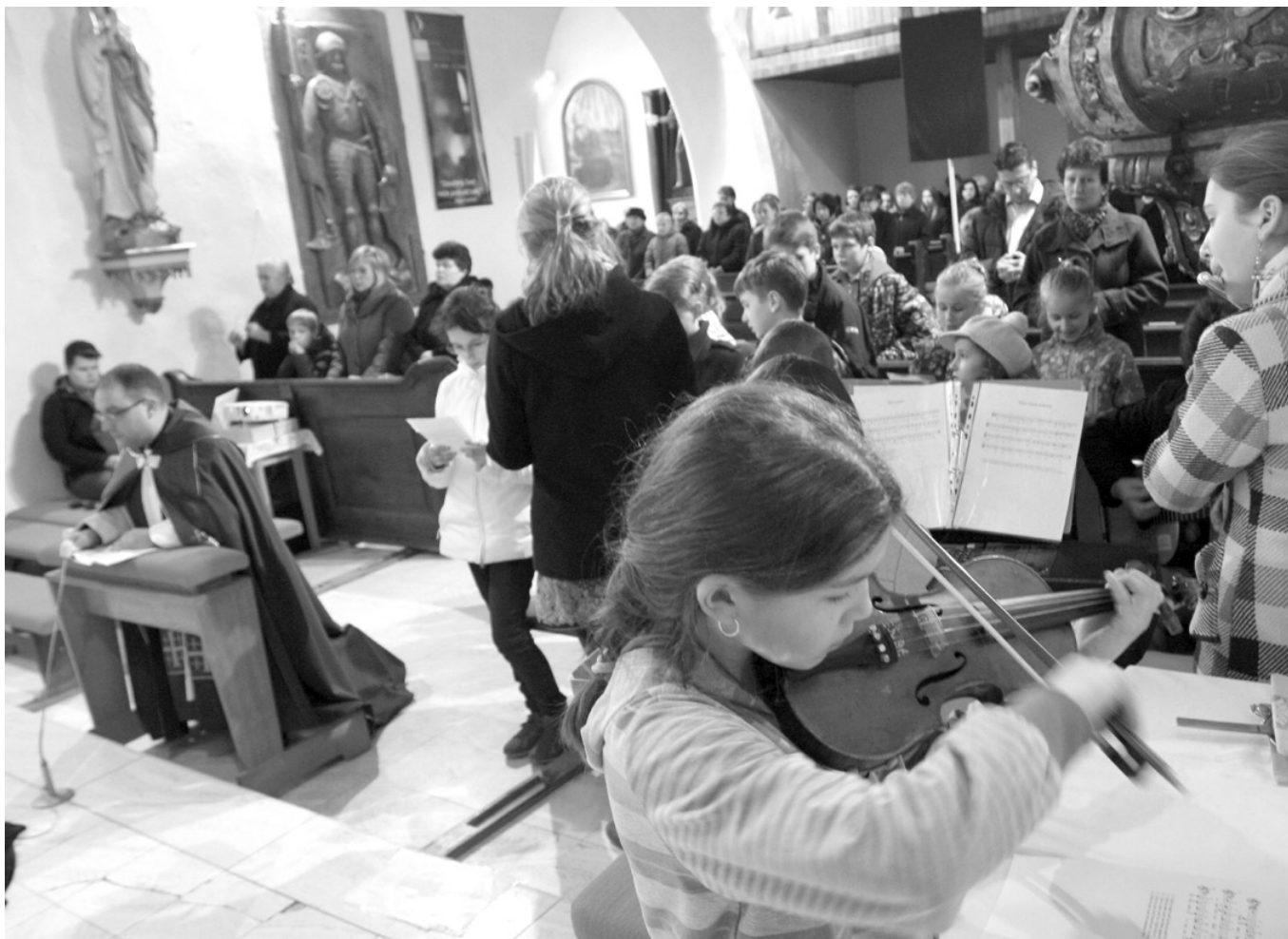
Krížová cesta detí v Markušovciach.