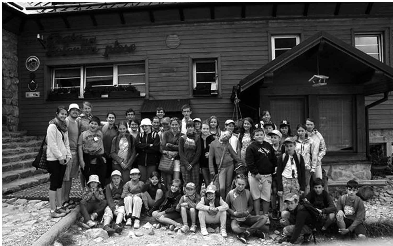
Veľký tábor detí.

Tento rok sme sa rozhodli urobiť letný tábor pre deti pod Belianskymi Tatrami v malebnej obci Ždiar. Táto obec je známa tým, že jej obyvateľmi sú gorali a tiež sa cez ňu prechádza k našim susedom Poliakom.