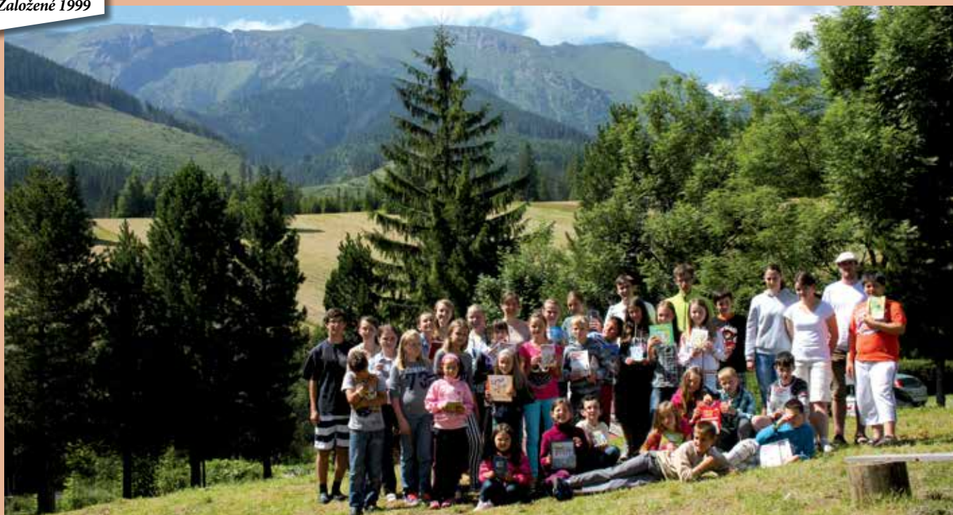
Veľký tábor detí