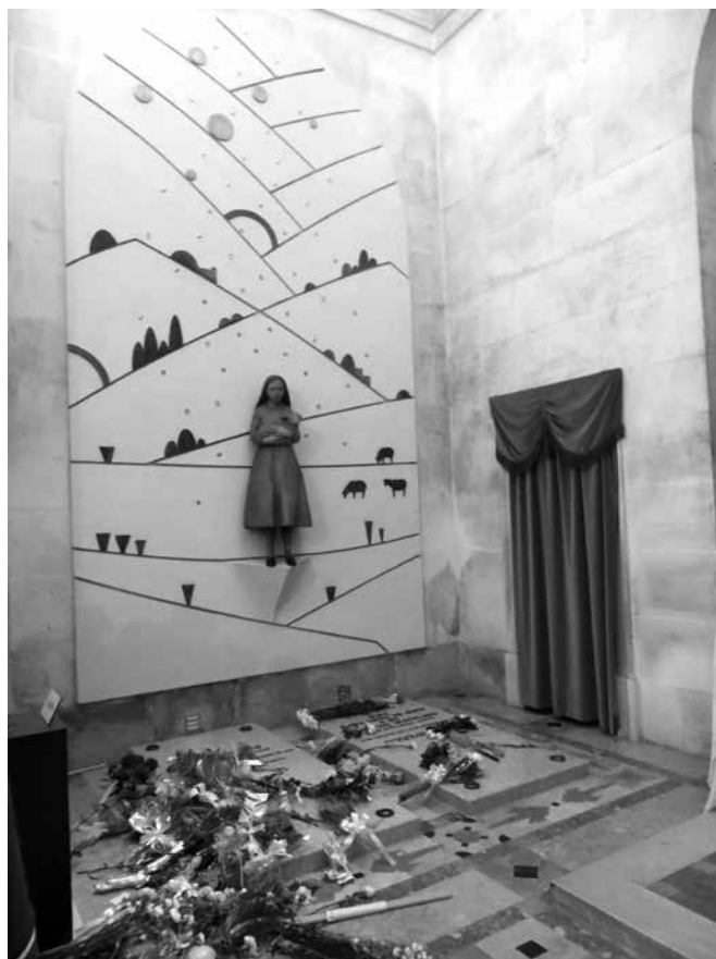
Hroby Hyacinty a Lucie

oltára je pochovaný František a vľavo Hyacinta a Lucia. Ich náhrobné kamene sú sústavne zahádzané živými kvetinkami. Umelecké stvárnenia detských postavičiek silno zapôsobia.