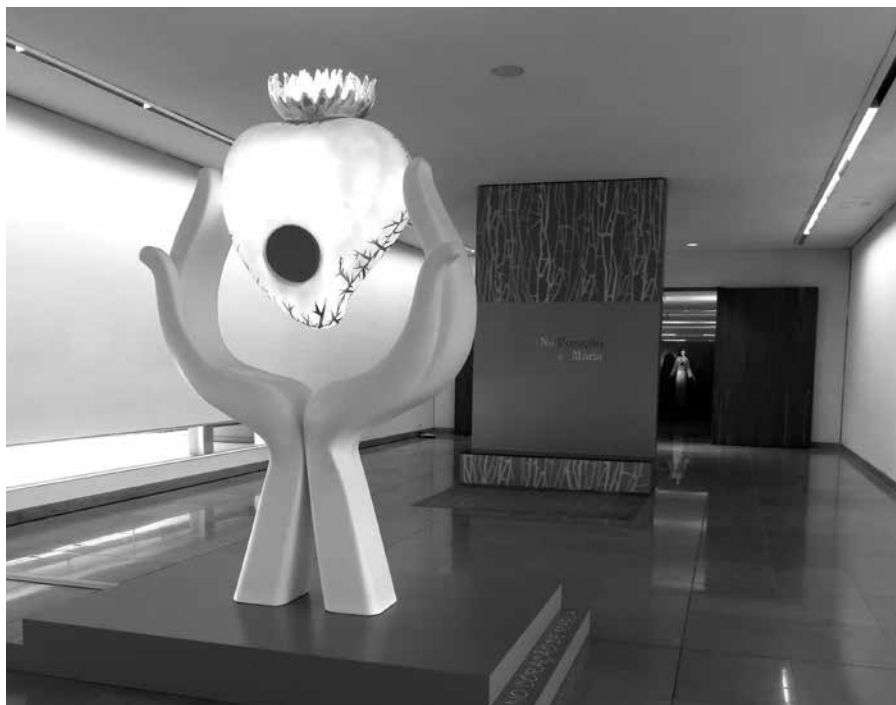
Stvárnenie srdca Panny Márie - v ňom zrkadlo, v ktorom sa môže človek vidieť

Južnejšie od Fatimy leží Lisabon . Má všetky atribúty hlavného mesta.