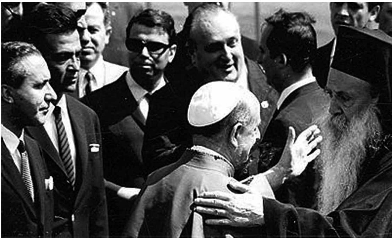
Pápež Pavol VI. v roku 1964 vykonal púť do Svätej zeme, kde sa stretol sa s patriarchom Athenagorom.

Termín „schizma“ v gréčtine znamená cirkevný rozkol, ktorý má vplyv nielen na jej učenie, ale aj na jej organizáciu a hierarchiu. Východná schizma je vyvrcholením liturgických, disciplinárnych, cirkevno-politických a dogmatických sporov medzi Západom a Východom resp. Západnou cirkvou a Východnou cirkvou. Preto rok 1054 znamenal medzi nimi radikálne vyhrotenie.