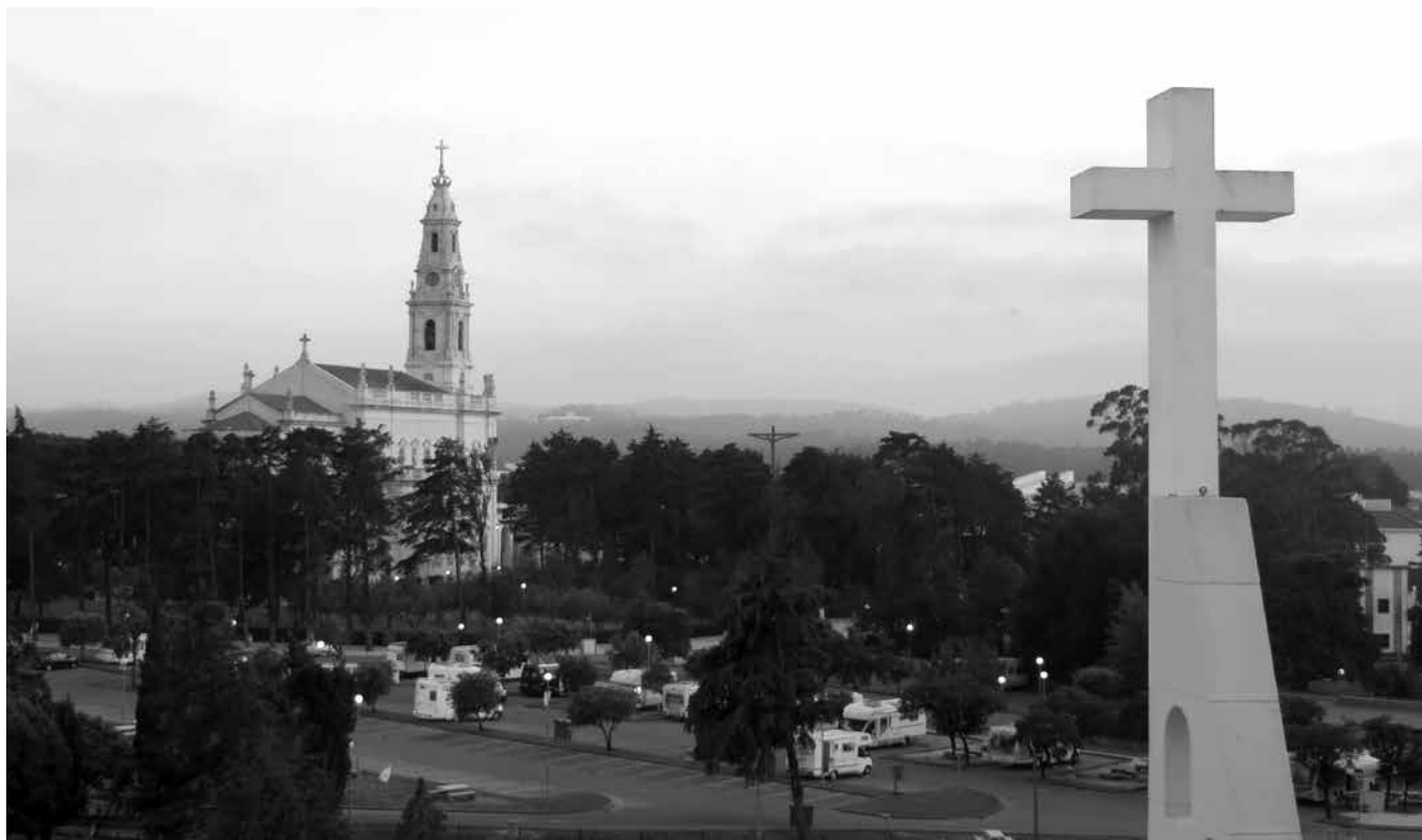
Fatima, pohľad na baziliku.

Krajina ležiaca na Pyrenejskom (Iberskom) polostrove v juhozápadnej Európe, oddelená od Afriky Gibraltárskym prielivom, ku ktorej patria ešte aj Azorské ostrovy a Madeira. Národ mnohých generácií obchodníkov a rybárov v odvekoch a úzkom spojení s Atlantickým oceánom. Portugalsko.