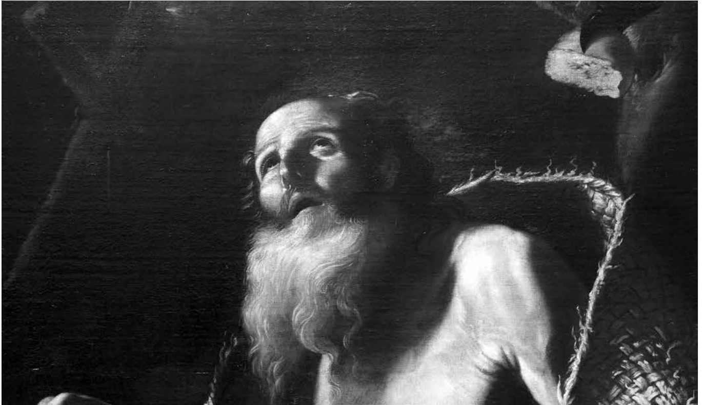
Sv. Pavol z Théb

To, že v Cirkvi vane Duch Svätý, môžeme vidieť aj na zrode rehoľného či mníšskeho života. Rehoľný život sa vyvinul z vnútra Cirkvi ako Božia odpoveď na potrebu doby. V 4. a 5. storočí sa rozrástol do hnutia, ktoré zachvátilo všetky vrstvy kresťanského ľudu. Ľudia vyhľadávali púšť, aby tam vydávali svedectvo Kristovi a celkom sa oddali Bohu. Rehoľný život má svoj pôvod v evanjeliu. Cieľ nasledovania Krista je žiť jedine pre Boha a žiť z daru jeho milosti. Aby toto ľudia dosiahli, vzdávajú sa majetku, rodinného života, vlastného ja. Kláštory sa stali centrami vzdelanosti a kultúry. Bez ich namáhavej a vďačnej práce, by sme sotva dosiahli taký kultúrny rozvoj, akého sme svedkami. Európa i ostatné časti sveta môžu vďačiť Cirkvi a kláštorom za ich skultúrnenie.