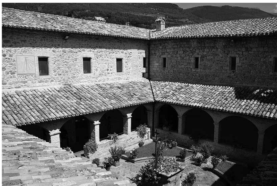
San Damiano - sv. Klára