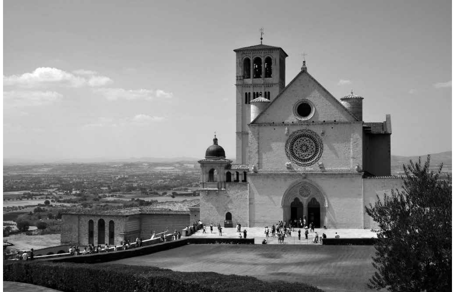
Bazilika San Francesco

Taliansko pozostáva z niekoľkých regiónov a každé z nich má svoje čaro. Najmenším z nich je Umbria – mnohými nepoznaný región, ktorý sa postupne vynára z tieňa známejšieho Toskánska. Je to vidiecky kraj, ktorého označujú za „zelené srdce Talianska“. Človek tu objaví množstvo nádherných starobylých miest ako Gubbio, Orvieto, Spoleto, Nursiu..., množstvo románskych kostolíkov, mestských palácov, kopec stredovekých stavieb, zákutí, klukatých uličiek s domčekmi vkusne vyzdobenými kvetinami, námestíčka so studňami, olivové sady, ale aj obrovské polia slnečníc. A, samozrejme, rodisko sv. Františka – Assisi.