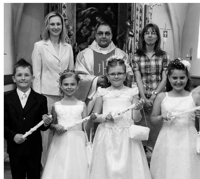
Prvoprijímajúce deti na Tepličke