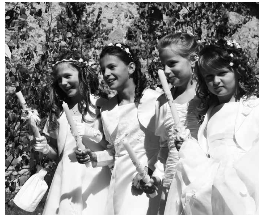
Prvoprijímajúce deti v Markušovciach