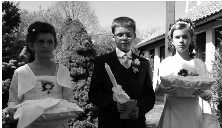
Prvoprijímajúce deti v Lieskovanoch

Chválou a radostným spevom privítali Pána Ježiša v Eucharistii markušovské deti 20. mája 2012. So spomienkami na slnečný slávnostný deň sa s nami podelili nielen deti. I rodičia ho prežívajú s dojatím a bážňou v srdci. Uprostred zmätku súčasnosti cítia potrebu výchovy v kresťanskom duchu a sami svedčia, prečo je dôležité pre ich dieťa sväté prijímanie.