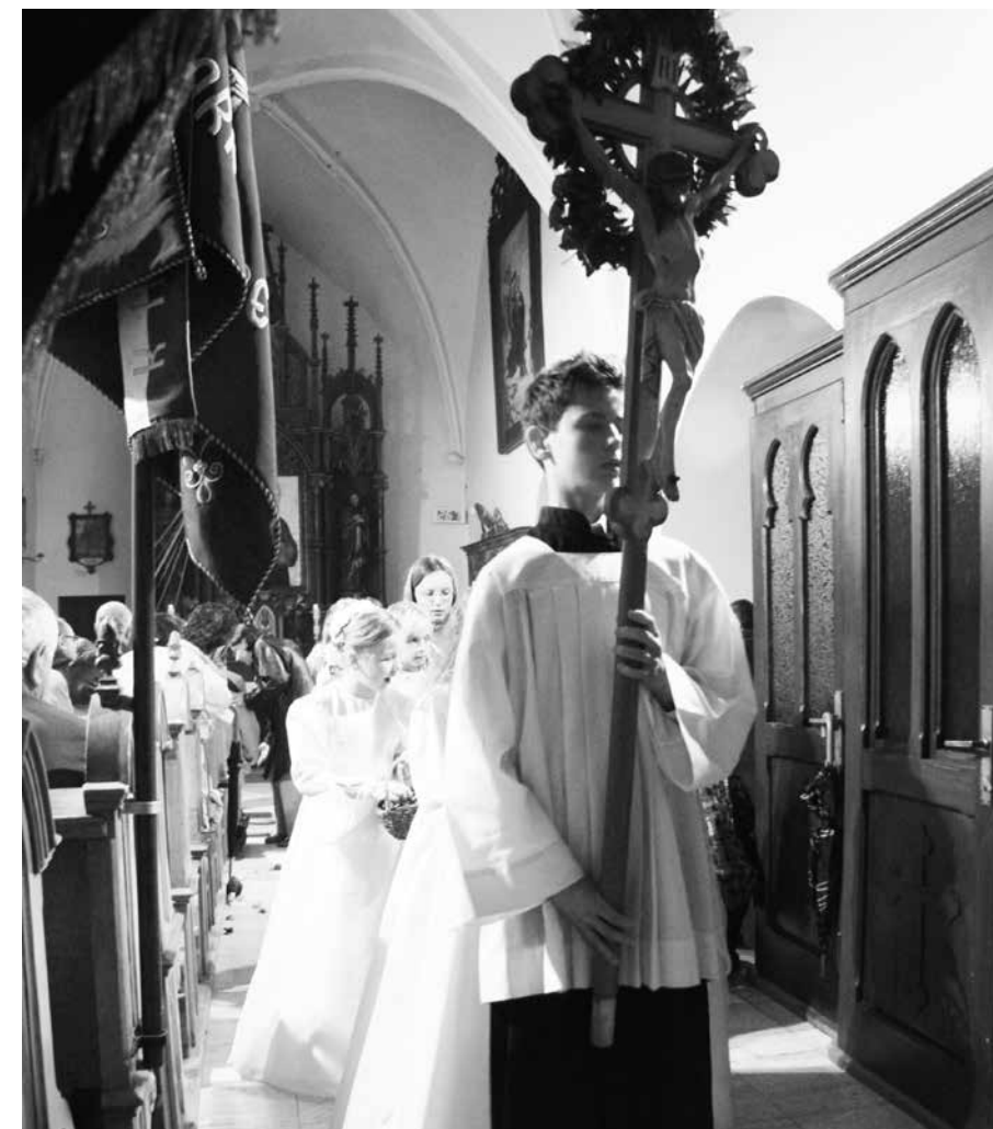
V markušovskom kostole

Keď teda večerali, vzal Ježiš chlieb, požehnal ho, rozlomil a dal učeníkom so slovami: „Vezmite a jedzte, toto je moje telo!“ Potom vzal kalich, vzdal vďaky a podal im ho so slovami: „Pite z neho všetci, toto je totiž moja krv Zmluvy, ktorá bude vyliala za vás na odpustenie hriechov.“ (Mt 26, 26 – 28)