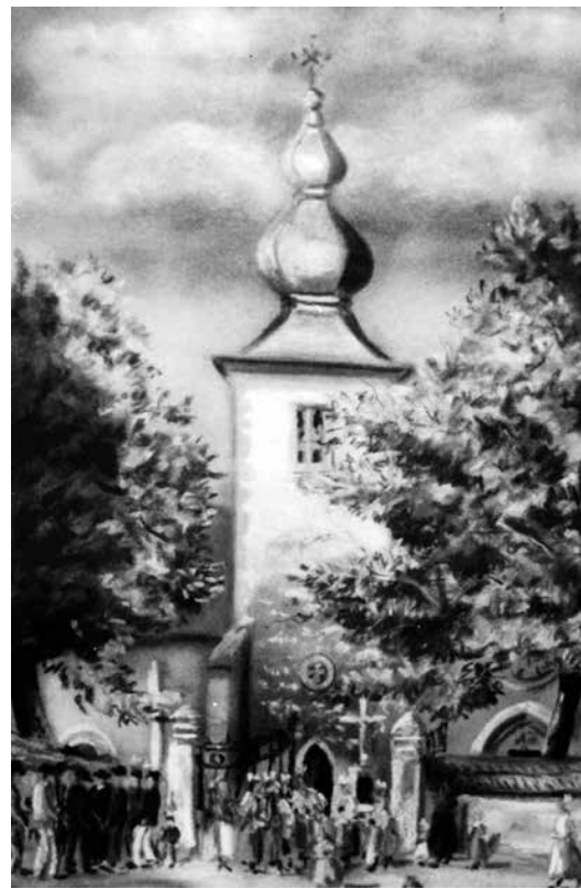
Malba kostola v Tepličke z 50-tých rokov 20. storočia od vtedajšieho učiteľa Eudovíta Uhrína.

Medená strecha, ktorá mala vydržať roky, sklamlala. Už po krátkej dobe začalo pretekať v obidvoch bočných lodiach. Ako vyriešiť tento pálčivý problém, trápil všetkých zodpovedných. Po mnohých bezúspešných jednaniach a pokusoch o reklamáciu, posudkov k možnosti opráv s negatívnymi vyjadreniami sa pristúpilo k radikálnemu rozhodnutiu: krytinu na problematických miestach bude potrebné vymeniť.