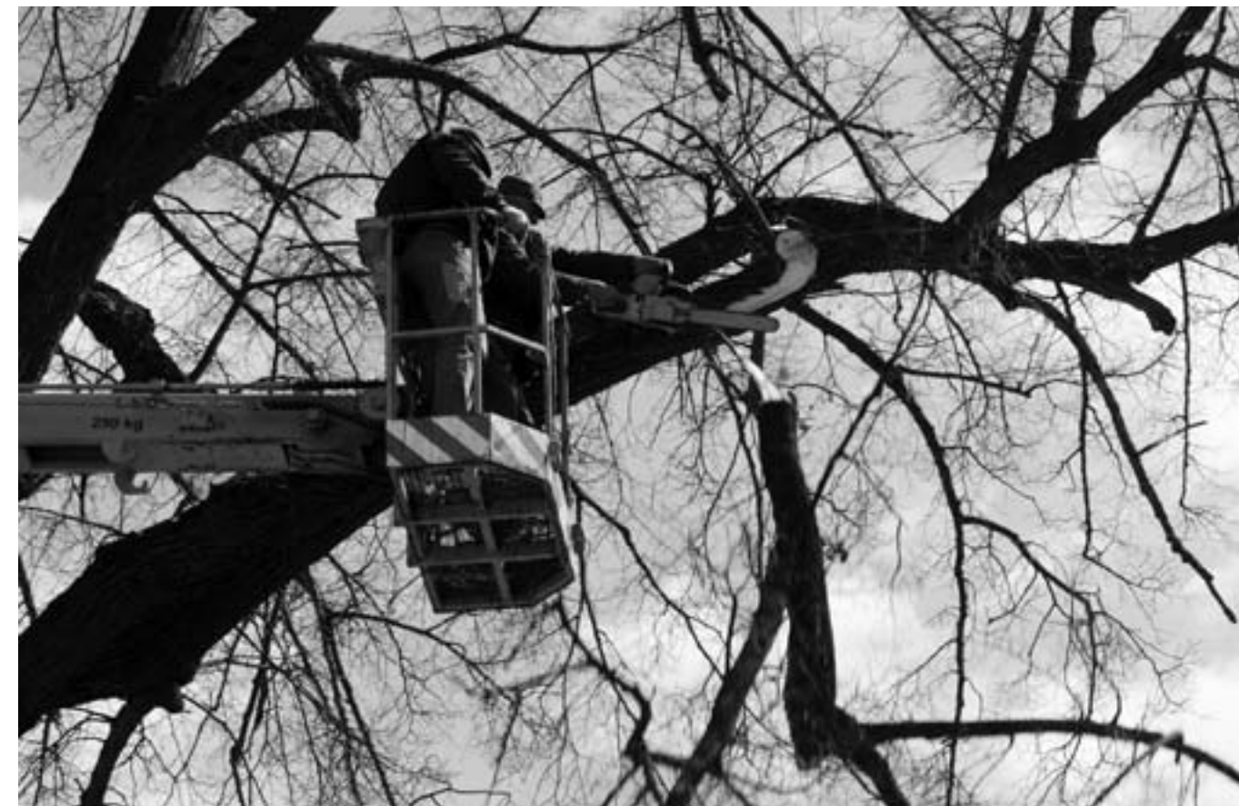
Usilovní dobrovolníci pri práci na kostolnom dvore v Markušovciach