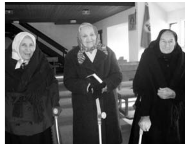
Farničky z Lieskovian na modlitbách vo svojom kostole

V tomto krásnom chválospeve je obsiahnutý celý význam Veľkej noci. Spája sa v ňom Starý a Nový zákon. Existuje výrok: „Nový zákon je v Starom zákone zastretý a Starý zákon je v Novom odostretý.“