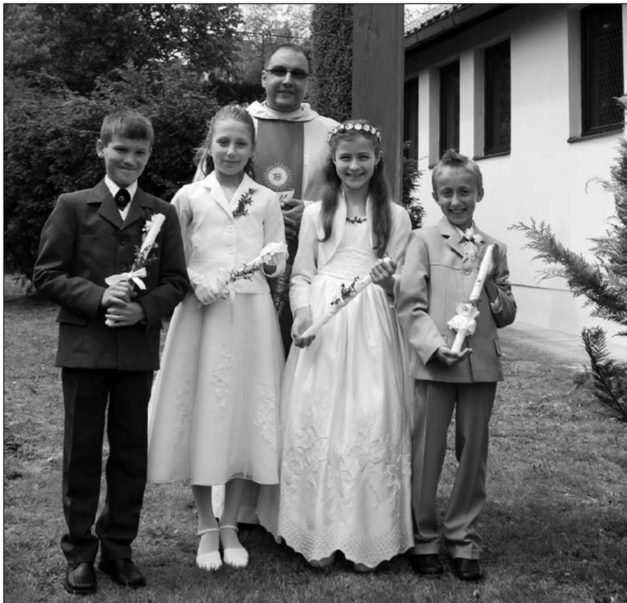
Prvé sväté prijímanie v Lieskovanoch

23. mája sa urobil nový chodník pred farou, keďže pôvodný chodník už