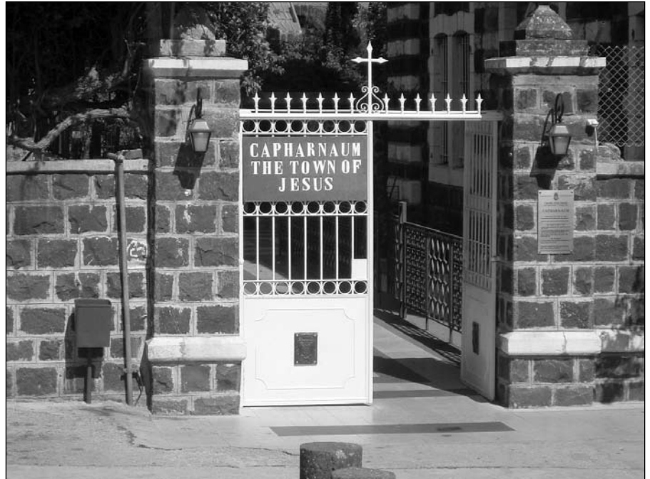
Vstup do mesta Kafarnaum