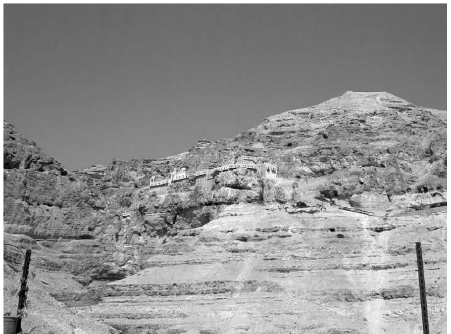
Kláštor pokúšania Ježiša Krista