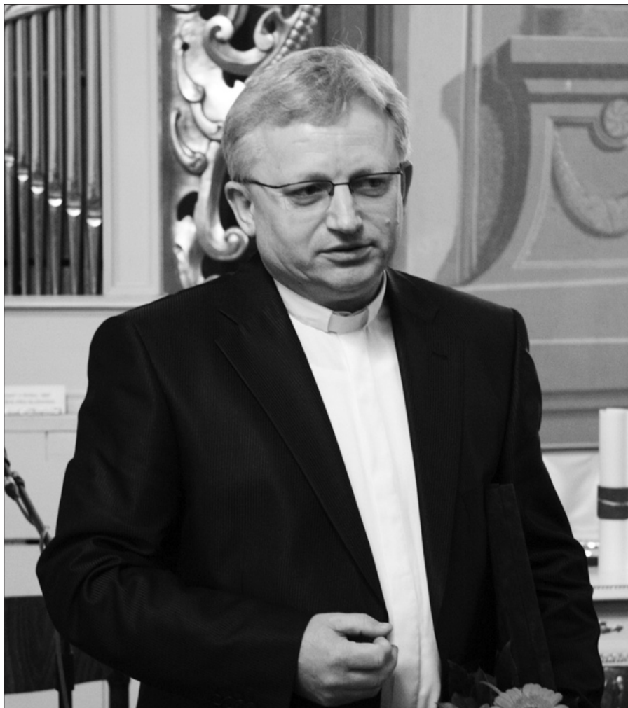
Udelenie Čestného občianstva v markušovských Dardanelách

Počas jeho účinkovania sa v kostole uskutočňovali tematické prednášky za účasti renomovaných prednášateľov na rôzne cirkevné, spoločenské a biblické témy. Tiež bol iniciátorom a zakladateľom Organovej školy