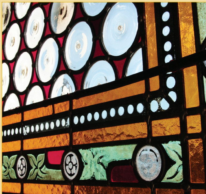
Nové vitráže v Markušovskom kostole