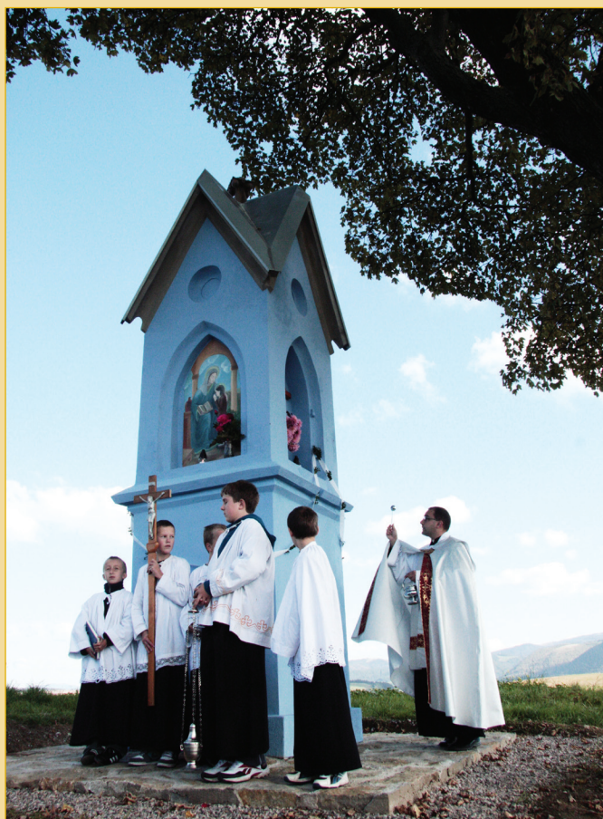
Obnovená kaplnka v Lieskovanoch