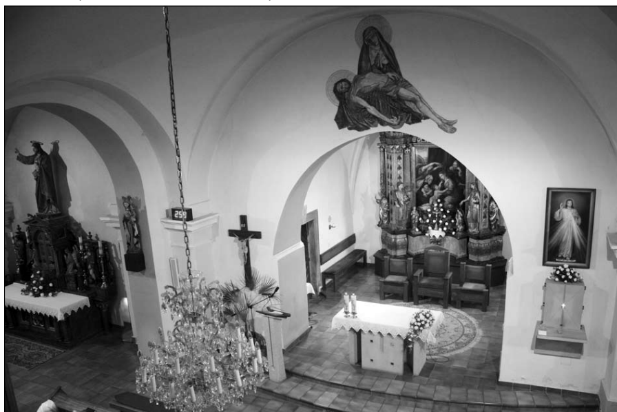
Pohľad na oltár z chóru v kostole v Tepličke