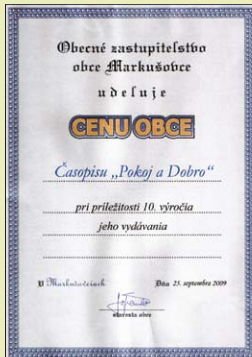
Redakcia ďakuje za ocenenie a teší sa z neho