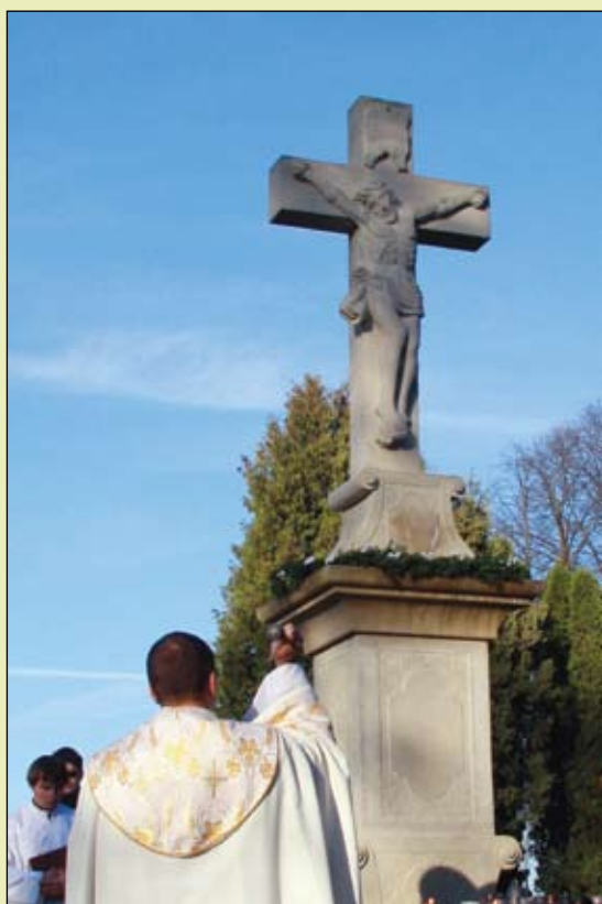
Požehnávanie nového kríža na markušovskom cintoríne