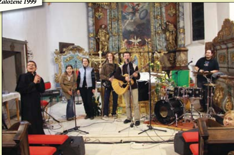
Koncert hudobnej skupiny Smaily