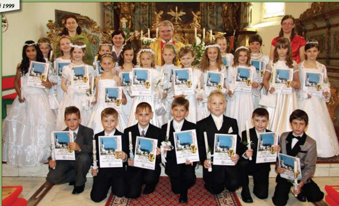
Prvoprijímajúce deti, Markušovce 2009