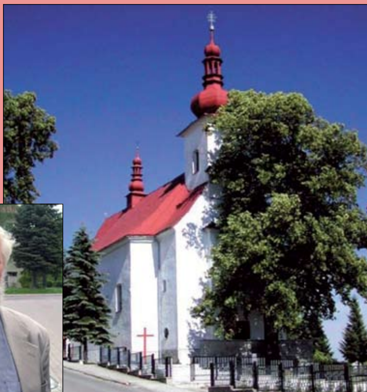
Farský kostol z roku 1816