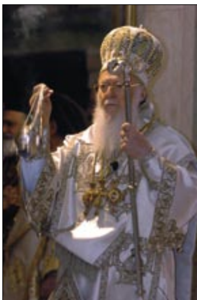
Bartolomej I., pravoslávny patriarcha v Istanbuli a jeho nádherné liturgické rúcho s bohatou zdobeným páliom okolo krku

Benedikt XVI. navštívil Turecko. Nebolo by na tom nič zaujímavé, keby sme si nevšimli, že sa snaží tak trochu podobať pravoslávny biskupom aj svojim oblečením. Ba vlastne nie je to pravoslávne oblečenie, je to oblečenie pápeža prvého tisícročia, kedy ešte kresťanstvo bolo jednotné. Všimnite si napríklad „pálium“ pravoslávneho patriarchu Istanbulu (Carihradu), ako sa nápadne podobá „páliu“, ktoré si zvolil a nosí Benedikt XVI. ako „paliu petrinum“ (Petrovo pálium). Aj akosi častejšie sa pápež oblieka do pozláteného bohoslužobného rúcha, ktoré už tradične nosievajú pravoslávni biskupi dodržiavajúc spôsob bohoslužby a omšového rúcha doby prvého tisícročia. Úsilie pápeža o jednotu s „druhým Rímom“ (patriarchom Carihradu) a „tretím Rímom“ (moskovským patriarchom) je dosť evidentné. Podľa slov Krista: „Aby jedno boli...“