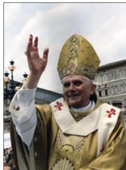
Benedikt XVI. v zlatom rúchu, okolo krku má páliu petrinum, ktorého tradícia siaha do 4. storočia