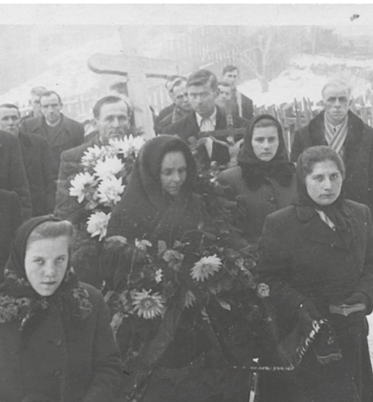
Pohreb na vyšnom konci, Markušovce, január 1947

Základnou ideológiou komunizmu bol ateizmus. Komunisti sa snažili v našom národe vykoreniť vieru. Vo svojom boji sa orientovali na kňazov, učiteľov, inteligenciu. Sledovali, zastražovali a mučili tých, ktorí sa netajili svojimi názormi a mali veľký vplyv na verejnosť. Po zrušení cirkevných škôl a kláštorov k nim patrili aj Bohu zasvätení mladí ľudia, ktorí u nás stratili možnosti sebarealizácie a snažili sa emigrovať na západ. V čase môjho detstva boli sväté omše v Tepličke len každú tretiu nedeľu. V ostatné sme chodili peši do farského kostola v Markušovciach. Na vyučovanie náboženstva bola potrebná prihláška podpísaná a doručená rodičmi riaditeľovi školy. Tí sa mali snažiť, aby počty detí na náboženstve boli čo najnižšie, často rodičov proti vlastnému presvedčeniu odhovárali, niekedy sa pred nimi skrývali. Najväčším svedectvom živej viery bolo pre mňa vyvrcholenie levočskej púte v roku 1989. Také množstvo ľudí som na Mariánskej hore nevidela predtým ani potom, s výnimkou návštevy Svätého Otca Jána Pavla II.