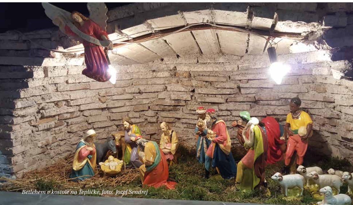
Betlehem v kostole na Tepličke, foto: Jozef Sendrej

Vianoce sú aj o ochote. O ochote Ježiša a o jeho poslušnosti voči Otcovej vôli. Ježiš musel veľmi milovať svojho Otca, aby ho v tejto extrémne ťažkej úlohe poslúchol. Prišiel, aby nám ukázal lásku a poslušnosť voči Bohu. A v neposlednom rade nás prišiel spasíť svojou smrťou na kríži.