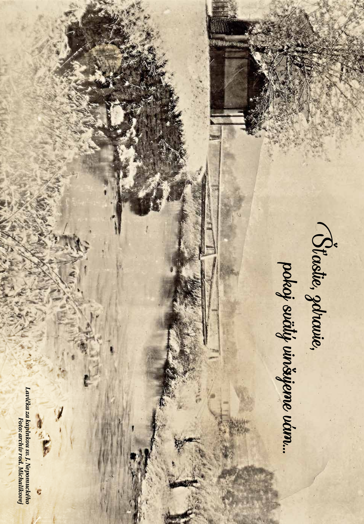
Lavička za kaphkou sv. J. Nepomuckého