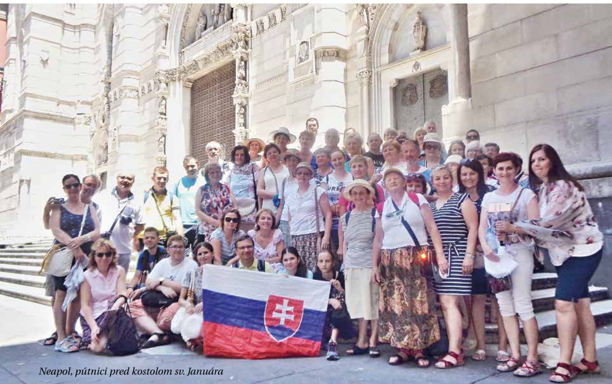
Neapol, pútnici pred kostolom sv. Januára