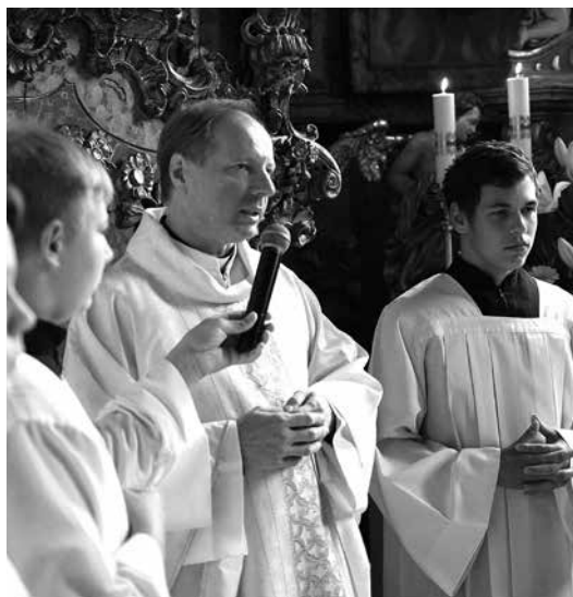
Markušovská odpustová slávnosť.

Odpovedať na túto otázku nie je vôbec ľahké. Keď tak nad tým uvažujem, tak asi aj to, že nie som na fare sám, že je tu pán kaplán, ktorý je ochotný vždy pomôcť a poradiť mi, pretože on je tu predsa len o dva roky pôsobenia dlhšie ako ja. Taktiež ma potešili miništranti v kostoloch a mladé rodiny.