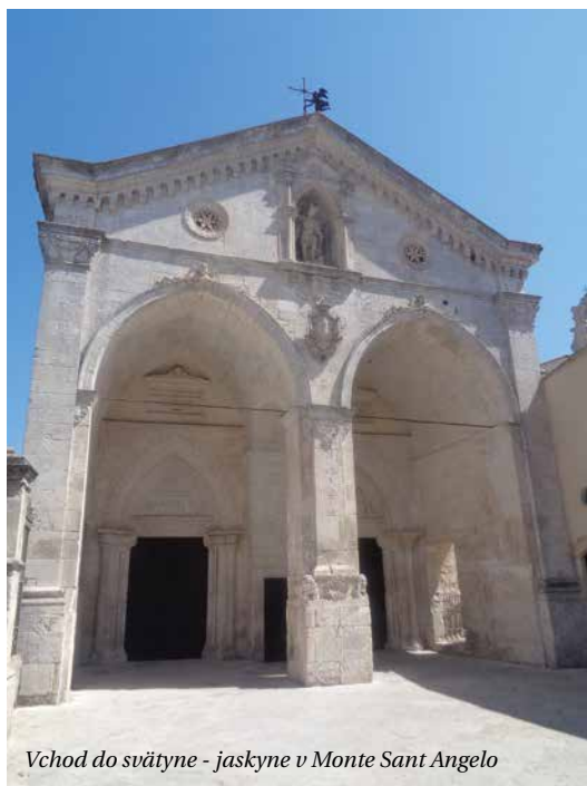
Vchod do svätyne - jaskyne v Monte Sant Angelo