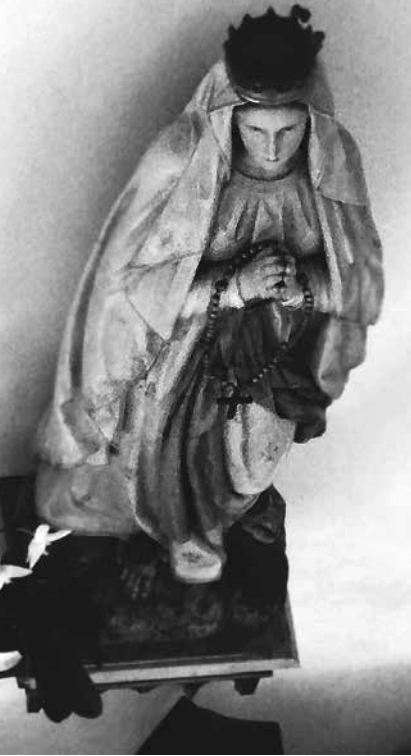
Socha Panny Márie v markušovskom kostole.

Približne 5 miliónov pútnikov z celého sveta každoročne zavíta do jaskyne, aby sa pomodlili a napili vody z vyvierajúceho prameňa, veriac, že od Boha obsiahnu uzdravenie tela i duše. Modlitby ruženca a prosby znejú v rôznych jazykoch, ale najviac francúzsky. Áno, tým miestom je Massabiellska jaskynka v Lurdoch.