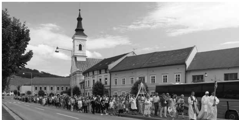
Procesia v Spišskom Podhradí