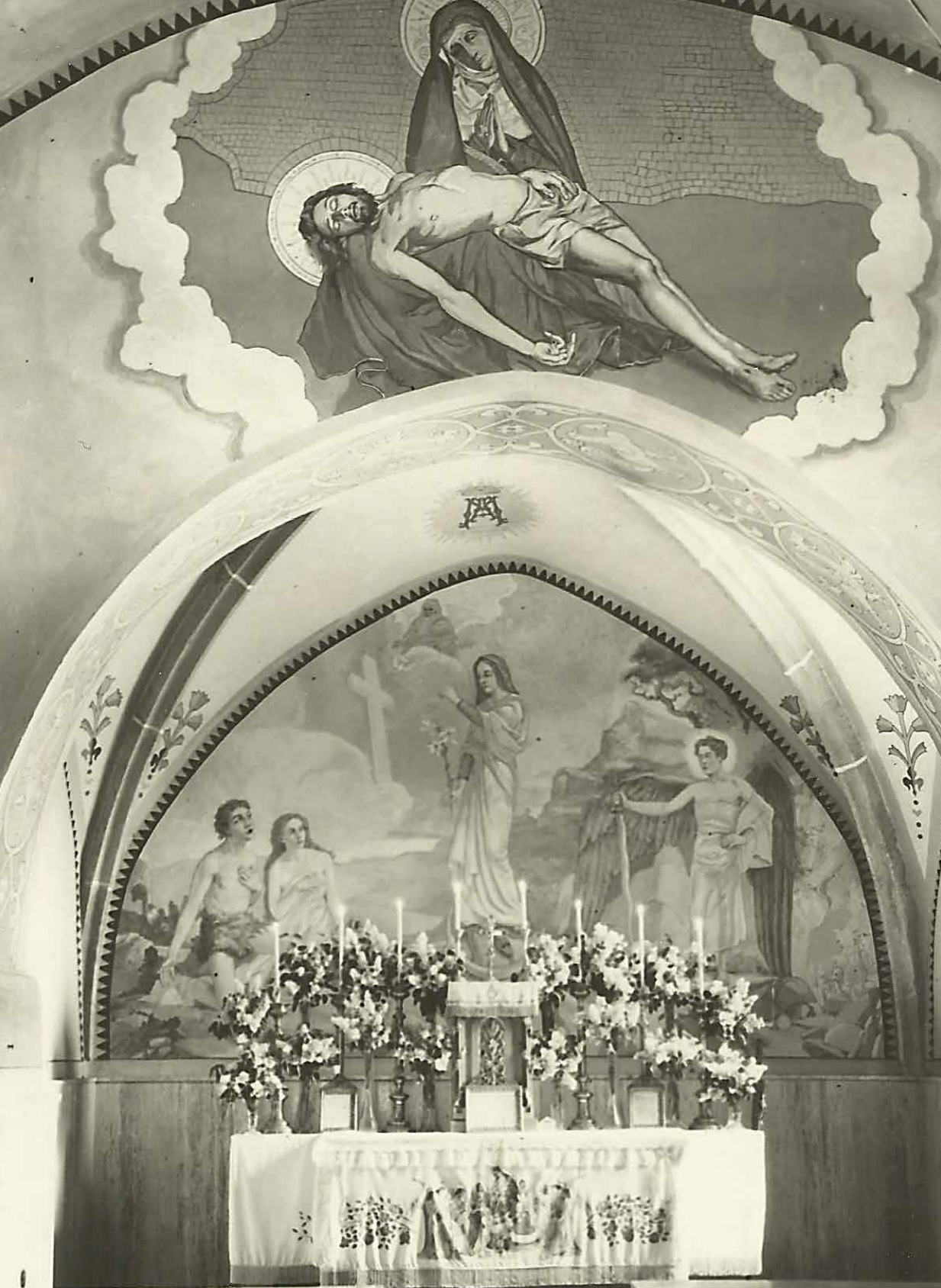
Olár s Pietou, r. 1956 na Tepličke