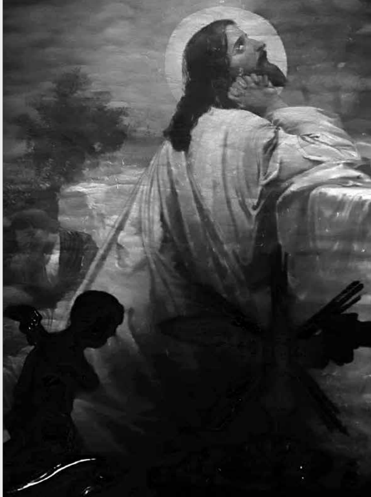
Obraz za oltárom v markušovskom kostole, foto: Peter Lazor -