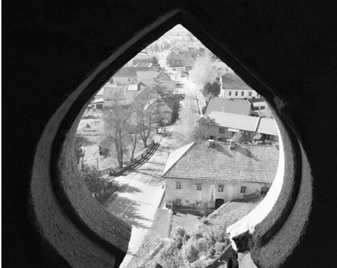
Pohľad z kostolnej veže markušovského kostola