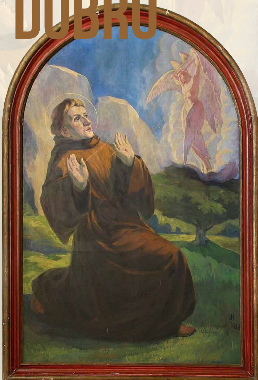
Sv. František. Obraz v bočnej lodi markušovského kostola.