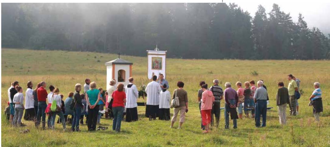
Júl 2017 - požehnanie obnovenej kaplnky, fotky: Adriana Lazorová