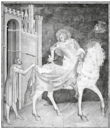
Freska sv. Martina z dolného kostola Baziliky sv. Františka v Assisi v kaplnke sv. Martina