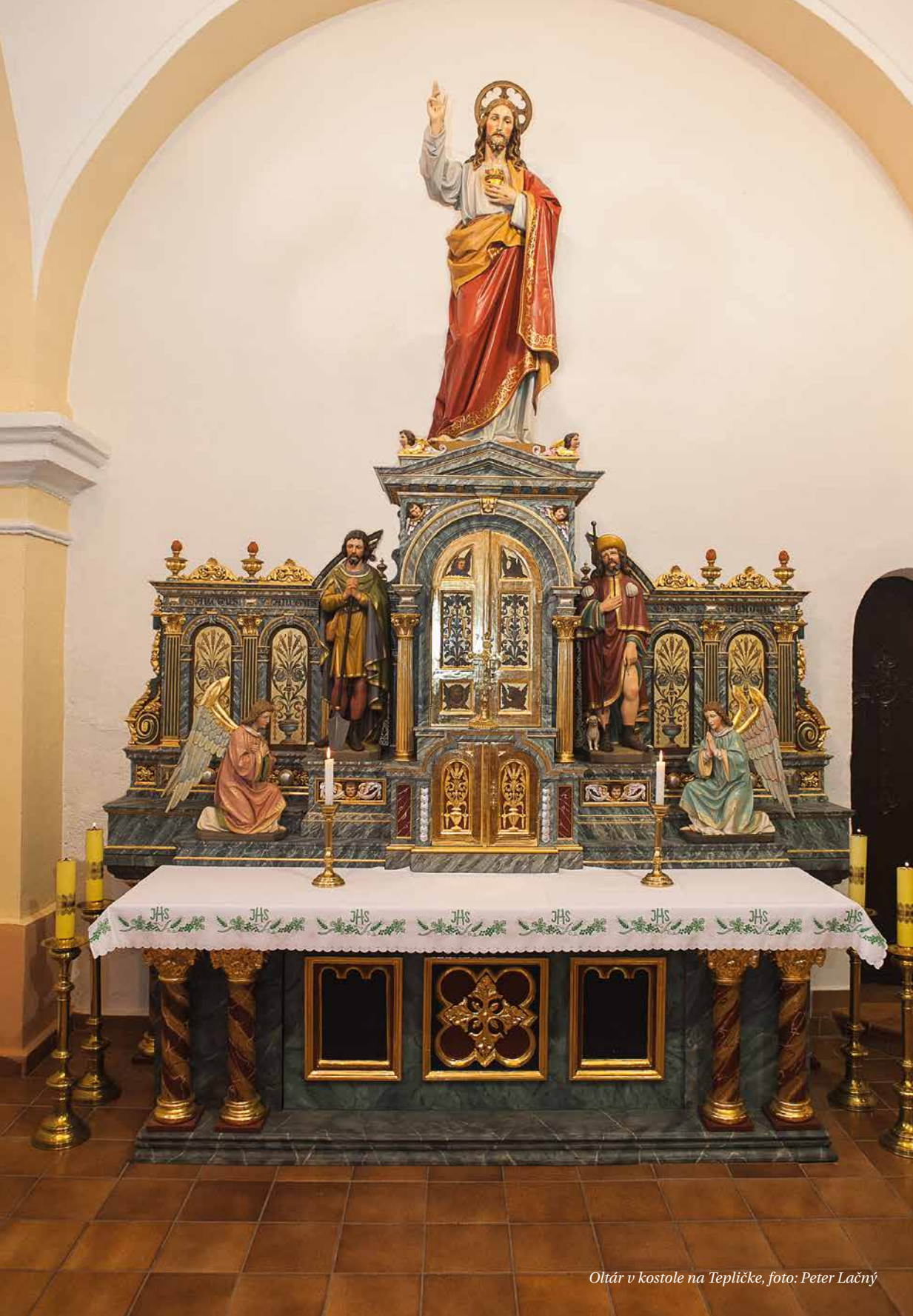
Oltár v kostole na Tepličke